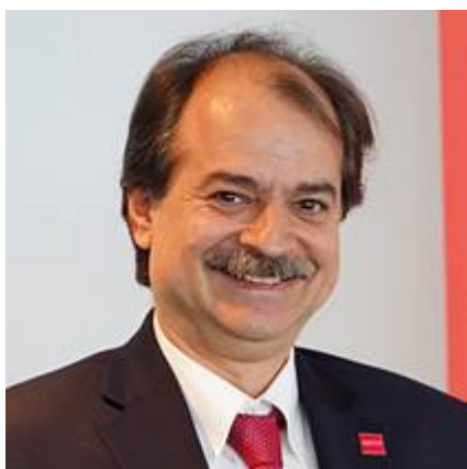
Prof. John Ioannidis

Over de hele wereld getuigden mensen dat ze voor ziektes als bijvoorbeeld een hartaanval, een verkeersongeluk, een pijnlijke val, of een beroerte, die niets met Covid-19 te maken had, toch als zodanig werden geregistreerd. Overal hoor je dezelfde verhalen. Op deze manier zijn het aantal slachtoffers door middel van allerlei medische protocollen, voorschriften en opdrachten kunstmatig opgekrikt. Artsen en verpleegkundigen kregen te horen hun baan te verliezen als ze met de media praten. Ook zijn overal mensen die zijn opgenomen in het ziekenhuis door zonder getest te zijn als Covid-19 patiënt ingeschreven.