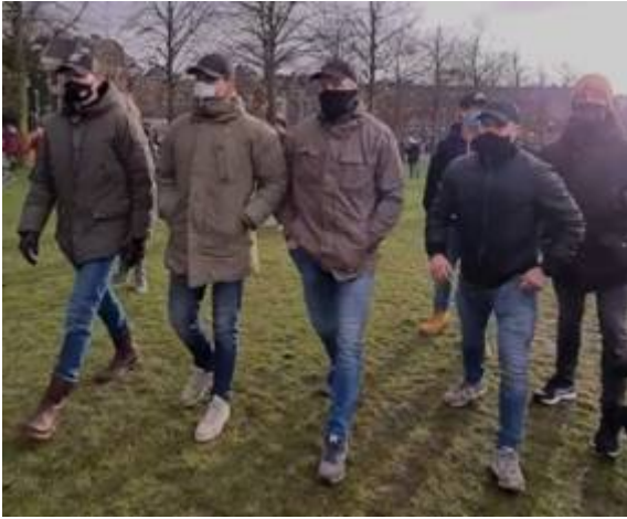
Romeo’s actief op het Malieveld op 14 maart 2021.