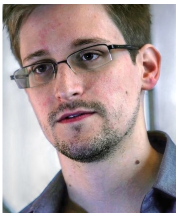
Edward Joseph Snowden

En natuurlijk spioneerde de NSA ook bij de Verenigde Naties. Toen Ban ki-Moon in april 2013 aanschoof bij Obama voor een gesprek over de Syrische chemische wapens, wisten de Amerikanen precies wat de VN-leider zou gaan zeggen. De geheime dienst NSA had de gesprekspunten van de VN-secretaris-generaal al voor de ontmoeting onderschept. Het afluisteren van de Verenigde Naties is in strijd met de internationale wetgeving, maar Washington treedt dit soort verdragen met voeten.