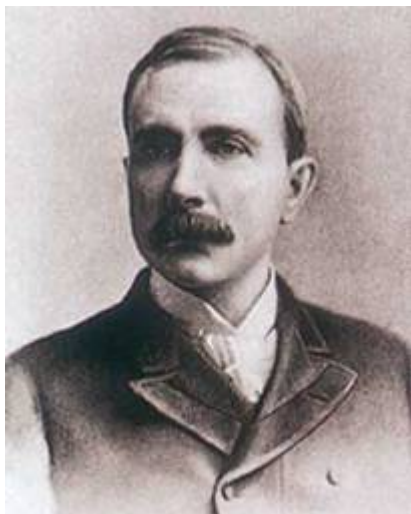
John D. Rockefeller Ca. 1875

De Rockefellers behoren tot de belangrijkste figuren die zo ongeveer achter alle wereldwijde complotten zitten. Zij worden gezien als de meest invloedrijke families uit de geschiedenis van de Verenigde Staten, naast de Rothschilds . Na John D. Rockefeller (1839-1937) werd de dynastie voortgezet met John D. Rockefeller jr. (1874-1960) en John D. Rockefeller III (1906-1978).