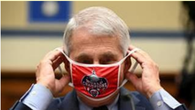
Anthony Fauci doneerde 3.7 miljoen dollar aan het laboratorium in Wuhan