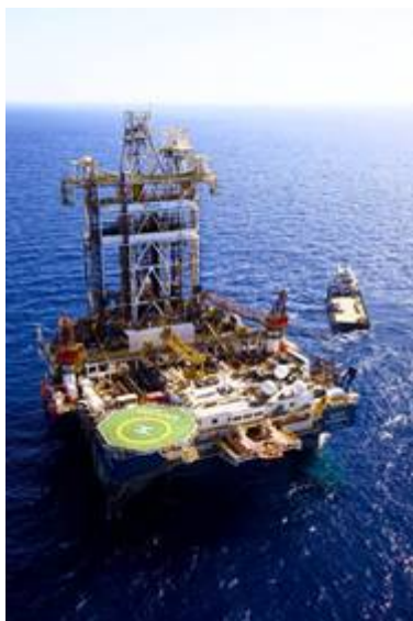
Het bedrijf Noble Energy actief in het gasveld Leviathan

Volgens een oud mopje wordt Mozes verweten een verkeerde weg te hebben ingeslagen toen hij het volk van Israël uit Egypte wegvoerde. Hij zou ze naar een plek in het Midden-Oosten hebben gebracht waar geen aardolie te vinden is, maar er zijn inmiddels enorme voorraden olie en gas aangeboord. Is dit misschien de buit waar Ezechiël op doelt? Het gaat om diverse gasvelden waarvan het Leviathan veld genoemd naar Bijbelse zeemonster tot dusver de grootste is. Dit veld bevat naar schatting 500 miljard kubieke meter aardgas.