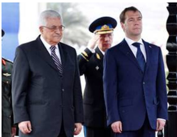
Kijk aan; PLO-leider Abu Mazen (Mahmoud Abbas) ontvangt Medvedev

Dinsdag 18 januari 2011 was de Russische president Dmitri Medvedev op visite in Ramallah (Samaria) en Jericho (Judea) om er zijn steun te betuigen aan de internationale anti-Israëlische campagne om een onafhankelijke nepstaat met de naam ‘Palestina’ te erkennen.