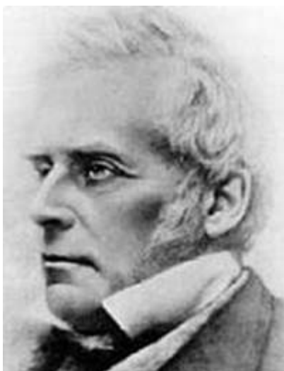
John Nelson Darby

De oude kerkvaders als Irenaeus (130-202), Tertullianus (160-240) , en in een latere tijd Cyrellus van Alexandrië (400-440) waren overtuigd van de boodschap van de opname van de Gemeente. Irenaeus was bisschop van Ephese en een leerling van de apostel Johannes. Later volgden onder meer de jezuïet Francisco Ribera (1537-1591) , de jezuïet Manuel De Lacunza (1731-1801) , Erward Irving (1792-1834) , John Nelson Darby (1800-1882) , Cyrus Scofield (1843-1921) , en daarna diverse kerk-en gemeente leiders in de 20-21 ste eeuw.