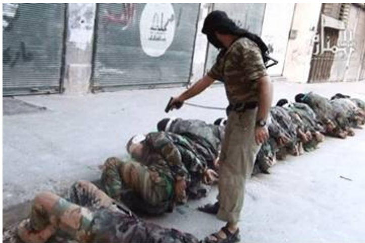
De door de VS gesteunde slachters van Al Nusra .

Wat begon als een gewone demonstratie op 15 maart 2011 tegen het bewind van dictator Bashar al-Assad in Syrië, is uitgegroeid tot een onvoorstelbare slachtpartij door zowel het Syrische leger als door allerlei (buitenlandse) moslimbendes. De wereld beschuldigt het bewind van Assad van alle ellende in het land maar dat is maar gedeeltelijk waar. Alle partijen maken zich schuldig aan oorlogsmisdaden. De misdaden die de strijdende partijen onder de Syrische bevolking aanrichten is huiveringwekkend. Wie telt de doden nog? Tot dusver zijn er 460.000 mensen om het leven gekomen waaronder naar schatting 20.000 kinderen. Klik hier om te zien wat er gebeurt met terroristen die door het Syrische leger in een hinderlaag worden gelokt.