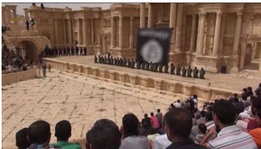
Executie Syrische militairen

De hellehonden van ISIS hebben zaterdag 4 juli 2015 beelden verspreid van een executie van 25 Syrische militairen in Palmyra . Het bloedbad is blijkens de beelden uitgevoerd kinderen in een amfitheater van de ruïnes van Palmyra. De executies vonden plaats voor een grote, zwarte IS-vlag. Te zien was hoe honderden mensen waaronder kinderen in burgerkleding toekijken terwijl de doodvonnissen werden voltrokken. Op close-ups is te zien dat een aantal slachtoffers vermoedelijk is mishandeld. De mannen moesten een doodvonnis aanhoren, waarna ze met pistoolschoten om het leven werden gebracht. Volgens IS ging het om regeringsmilitairen die in de stad Homs gevangen waren genomen. Al Jazeera meldt dat er sinds het begin van 2015 tenminste 52 kindsoldaten onder de leeftijd van 16 jaar om het leven zijn gekomen.