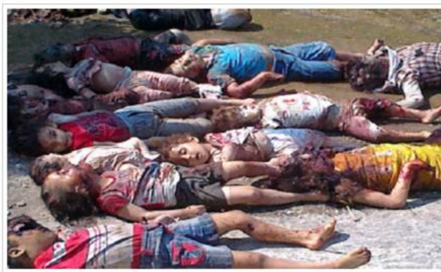
Door moslims vermoorde Syrische kinderen.

Hoe gruwelijk de Jihadisten in Syrië te keer gaan mag blijken uit een gebeurtenis in het oostelijk deel van Syrië aan de grens met Irak. Hier lieten de door Obama gesteunde leden van de niet bestaande “ Free Syrian Army ” een klein meisje toekijken hoe haar vader en moeder werden vermoord omdat zij behoorden tot de Shia moslimbeweging. Vervolgens sneden ze het hart uit het meisje . Waarschuwing: gruwelijke beelden . Wat hier te zien is is niet alleen het ware gezicht van de islam , het gaat veel verder dan dat. Het bloed van dit kleine meisje kleeft namelijk ook aan de handen van allen deze bendes met geld en wapens ondersteunen. Op maandag 16 december 2013 vielen jihadisten van het al-Nusra Front een bakkerij in de plaats Adra binnen en verbranden de medewerkers vervolgens in hun eigen ovens .