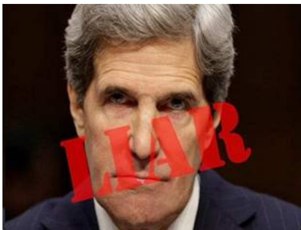
Scull&Bones John Kerry, aartsleugenaar

Wat ook opvalt, is dat de mainstream media er alles aan doet Obama en Kerry met hun misleidende propaganda zo geloofwaardig mogelijk over te laten komen. Volgens Kerry zijn de Amerikanen moe van de oorlog , en hijzelf ook. Zijn woorden klinken echter niet erg overtuigend en zelfs regelrechte leugens worden door hem tot waarheden getransformeerd. Poetin zei het al: ze liegen alles aan elkaar vast en zijn bezig het hele Midden-Oosten te destabiliseren. 'Wij dachten met een fatsoenlijke man van doen te hebben, maar John Kerry is een leugenaar en hij weet dat zelf ook.' Kerry vergelijkt Assad met Hitler en dat werkt natuurlijk altijd. Dergelijke doembeelden doen het goed bij de grote massa.