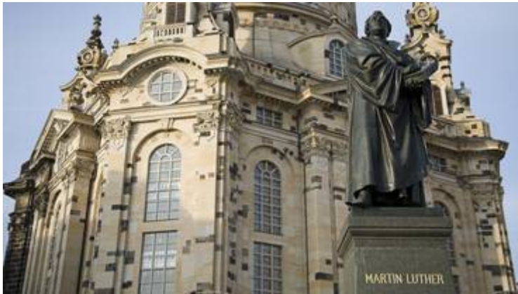
Standbeeld Luther in Dresden.

hun wandaden moesten verantwoorden voor het tribunaal van Neurenberg.