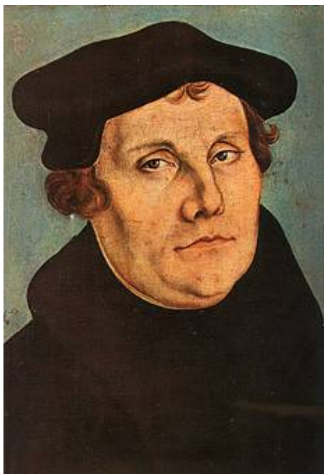
Maarten Luther geschilderd door Lucas Cranach de Oude in 1529 (Wikipedia)

Op 31 oktober 2017 was het 500 jaar geleden dat Maarten Luther zijn 95 stellingen aan de kerkdeur in Wittenberg bevestigde, waarmee hij de grootste revolutie in de Europese kerkgeschiedenis ontketende. De 95 stellingen zijn korte beweringen, die samen een lopend betoog vormen. Luther haalde verschillende Bijbelteksten aan, om aan te tonen dat toenmalige praktijken in tegenspraak waren met de Bijbel. Door de uitvinding van de boekdrukkunst werden Luthers stellingen al snel door heel Duitsland en Europa verspreid. Door de grote beroering die hierdoor ontstond zag Luther zich gedwongen de stellingen met verdere publicaties toe te lichten. Grote beroering ontstond ook omdat de – toen almachtige – Rooms-katholieke Kerk in Rome een kerkelijk proces tegen hem aanspande. Ook werd hij bedreigd door de Rooms-katholieke Kerk in Duitsland.