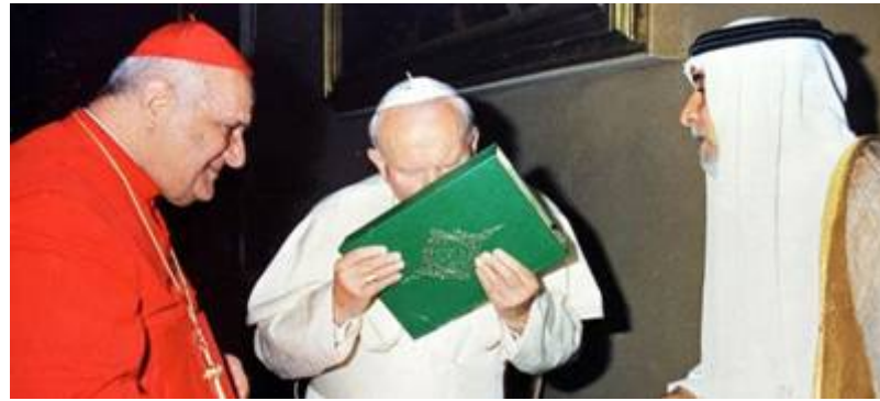
Johannes Paulus II kust de koran

liet geen enkele gelegenheid voorbij gaan Gods volk te vervloeken. Sabri vroeg de paus te helpen een einde te maken aan de Israëlsche 'bezetting' van Jeruzalem.