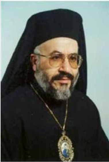
De Grieks-Melkitische aartsbisschop Cyrille Salim Bustros

In oktober 2010 werd in Rome een katholieke synode gehouden van bisschoppen uit het Midden-Oosten, waar alles werd gedaan om de verbinding tussen de Bijbel en de staat Israël te ontkennen. Zo zei de door paus Benedictus XVI aangewezen Grieks-Melkitische aartsbisschop Cyrille Salim Bustros: „ Voor christenen bestaat er geen beloofd land voor de Joden. Er bestaat niet langer een uitverkoren volk. Het concept van een beloofd land kan niet worden gebruikt als een argument om de terugkeer van de Joden naar Israël en de uitwijzing van de Palestijnen te rechtvaardigen. Het rechtvaardigen van de bezetting van Palestina door Israël kan niet worden verdedigd op basis van de heilige Schrift. ” Deze uitspraken en de slotverklaring van de Midden-Oosten synode zet de kerk jaren terug in het proces van verzoening tussen de kerk, het Joodse volk en Israël. Een proces dat werd geïnitieerd en ondersteund door de pausen Johannes Paulus II en Benedictus XVI. ‘Dergelijke theologische discussies over de uitleg van de Bijbel dateren nog uit de Middeleeuwen.