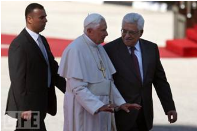
Bethlehem, 13 mei 2009. Paus Benedictus VI – in zijn jonge jaren nog lid van de Hitlerjugend – samen met Abu Mazen (Mahmoud Abbas) de leider van het Fatah/PLO bewind.

PLO-leider en Holocaust-revisionist Abu Mazen (Mahmoud Abbas) die ooit nog afstudeerde aan de Lumumba Universiteit in Moskou met een proefschrift waarin hij de Holocaust minimaliseerde, was natuurlijk bijzonder blij met de uitspraken van de paus. Staand naast Mazen riep hij Israël op om ‘de vrede te omarmen’. Alsof de “Bende van Ramallah” dat al gedaan had! Tijdens zijn bezoek aan Yad Vashem bad hij niet om vergeving voor de vernietiging van de zes miljoen Joden in de Holocaust, en noemde ook in zijn rede de Duitse nazi's niet. Ook weigerde hij een bepaald deel van het Holocaust herdenkingsmuseum te bezoeken omdat er een foto hangt van ‘ oorlogspaus' Pius XII die paus was tussen 1939 en 1958.