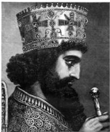
Xerxes (Koning Ahasveros)

Het Joodse volk viert ieder jaar het Poerimfeest (Hebreeuws: פורים), en gedenken daarmee de bevrijding van het Joodse volk dat in de vijfde eeuw v. Chr. in ballingschap leefde in het rijk van de Meden en Perzen (het Perzische Rijk). Poerim valt een maand voor Pesach. Een andere naam voor Poerim is Lotenfeest. Die naam verwijst naar de nieuwe loten die in de lente aan bomen en struiken ontspruiten. In het Perzisch betekent poer 'lot'. Het wordt gevierd op 14 e adar op de Joodse kalender en valt daarmee in het vroege voorjaar. De Joodse kalender is een 'maankalender' en Poerim valt daardoor elk jaar op een andere dag. Op deze dag wordt het feest gehouden in de open dorpen en steden, op de 15 e in de ommuurde steden. Het feest herinnert aan de dreigende ondergang van het Joodse volk. Het Poerimfeest verwijst naar de geschiedenis van Mordechai en Esther. Deze geschiedenis wordt beschreven in het boek Esther. Door haar schoonheid was het Joodse meisje Esther (haar Hebreeuwse naam is Hadassa) aan het hof van koning Ahasveros ( Xerxes ) terecht gekomen. Ahasveros regeerde van India (het huidige Pakistan) tot aan Cusj (het huidige Ethiopië) aan toe. De troon van de koning stond in Susan, in het westen van Perzië. Deze stad heet nu Shush en ligt in het zuidwesten van het huidige Iran.