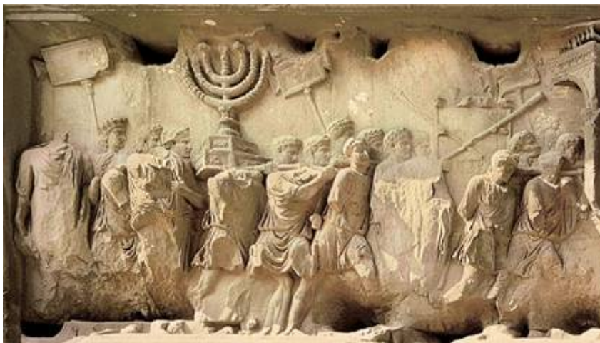
Menora in triomftocht meegenomen naar Rome

Als het jaar 70 na Christus is aangebroken, trekt het Romeinse leger onder aanvoering van Titus, Jeruzalem binnen en verwoest de hele stad en de Tempel. Al het roofgoed waaronder de Menora, wordt in triomftocht mee naar Rome genomen en daar tentoongesteld. Na de verwoesting hieven de Romeinen de juichkreet “hep-hep hoorah” aan. Het bekende ‘hiep-hiep-hoera’ is daar van afgeleid. HEP staat voor Hersalyma Est Perdita! ( Jeruzalem is verwoest! ). De kreet “hep-hep” was in 1814 in Duitsland opnieuw te horen tijdens anti-semitische studentenrellen. Dat waren de zogenaamde 'hep-hep-rellen'.