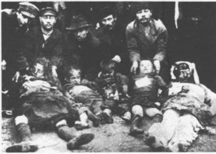
Figure 40. Five of the 49 victims of the Kishinev Pogroms in 1903.

leiders vermoord. In 1919 kwamen bij een serie pogroms tienduizenden Russische Joden om het leven. Het zwaartepunt van de gewelddadigheden lag in de Oekraïne, waar maar liefst 685 pogroms plaatsvonden. De Sovjets besloten het politiek invloedrijke Russische zionisme te vernietigen. Bovendien werden alle religieuze Joodse instellingen in de Sovjet-Unie opgeheven en hun bezittingen in beslag genomen. In 1920 vonden er in de Oekraïne opnieuw 142 pogroms plaats waarbij duizenden doden vielen.