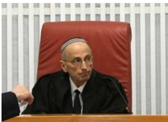
Voormalige rechter Edmond Levy's commissierapport verklaart het wettelijk recht van Israël op het bezit van Judea en Samaria

Dat er geen sprake is van enige bezetting, bleek ook nog eens uit het onderzoek van een commissie die werd voorgezeten door rechter Edmund Levy en die bestond uit hogere juristen. Deze commissie werd in 2011 ingesteld door Benjamin Netanyahu om diepgaand juridisch onderzoek te doen naar de status van Israël en de nederzettingen in Samaria en Judea. De commissie kwam in een 90 pagina's tellend rapport inclusief bijlagen, tot de conclusie dat in zuiver wettelijke termen Israël geen bezettende macht is in Judea en Samaria , integendeel: het is de rechtmatige eigenaar. Het begrip 'Palestijnen' voor Arabieren dateert uit de jaren 1960 (daarvoor werden de Joden er mee aangeduid). Zie uitgebreider: Het mythische land Palestina en 'Het Palestijnse volk bestaat niet' .