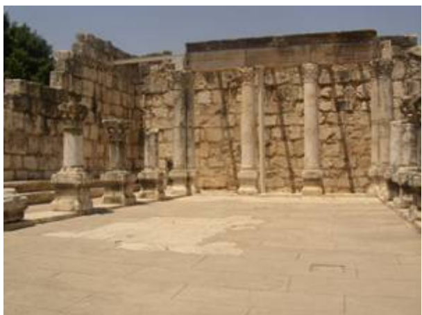
De synagoge in Kapernaüm

van het land blijven wonen. Bewijzen daarvoor zijn onder meer te vinden in Kapernaüm, waar de resten te zien zijn van een synagoge uit de vierde eeuw n.Chr. Deze synagoge was gebouwd op de fundamenten van de synagoge uit het begin van de jaartelling.