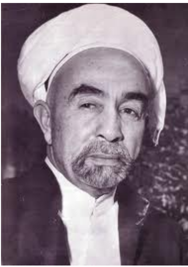
Koning Abdullah, de verwoester van Jeruzalem

Nu Israël Samaria en Judea in bezit heeft is het favoriete woord “bezetting” en spreekt men van de “westbank”. Woorden waarin de haat tegen de Joodse staat tot uitdrukking wordt gebracht. Het zijn dus de Arabische staten, die de Arabieren van hun zogenaamde ‘legitieme rechten’, die ze in 1947 van de Verenigde Naties hadden gekregen, hebben beroofd. De oorlogstoestand bracht een stroom van zo’n 350.000 (deze aantallen werden later opgedreven) Arabische vluchtelingen op gang naar de Arabische landen waar ze in vluchtelingenkampen werden gestopt om zo de haat jegens de Joodse staat zorgvuldig in stand te houden.