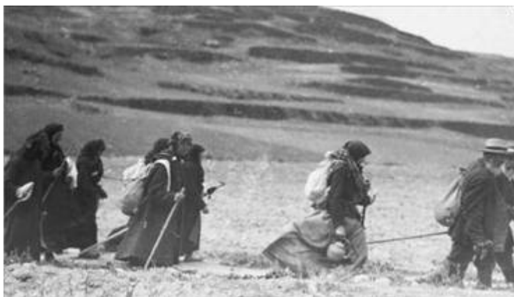
Joodse immigranten uit Rusland

De Engelse politiek werd door imperiale motieven geleid. Vooral in verband met de rijke oliebronnen van het Midden-Oosten wilden de Engelsen de Arabieren te vriend houden. Daarom hebben zij reeds de toegestane Joodse immigratie getraineed en beperkt, volkomen ongevoelig voor de wreedheid die zij daarmee tegen een toch al zo afschuwelijk gemarteld volk begingen. Toch arriveerden er tussen 1929 en 1939, met het opkomende nazisme in Duitsland, nog 250.000 immigranten uit Oost-Europa en Duitsland. Het merendeel van hen arriveerde tussen 1933 en 1936. Hierna sloten de Britten Israël steeds meer af voor Joodse immigranten, dit in volstrekte tegenstelling tot de resolutie van de Volkerenbond waarin juist de Britten de immigratie naar het nieuwe Joodse tehuis, dienden te activeren. Ondanks de Britse restricties kwamen er toch nog ongeveer 110.000 Joden via de Alija Bet aan in het aloude thuisland. De 'Alija Bet' was de naam voor de immigratie tussen 1933 en 1948