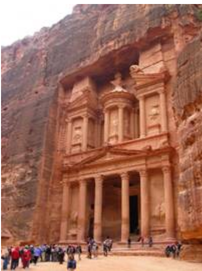
Petra in Jordanië

Jordanië bestaat uit onder meer de gebieden Edom, Moab, Ammon en Gilead. Met uitzondering van Edom maken deze gebieden deel uit van het aan Israël beloofde land. Het land is bij toeristen vooral bekend om de stad Petra dat in een vallei ligt in het bijna onherbergzame gebied van Edom. De stad is bereikbaar via een nauwe kronkelende kloof die de naam "El Sik" draagt. Tijdens de belegering van Jeruzalem door de Romeinen in het jaar 70 na Chr. waren het de eerste christenen die een veilig heenkomen zochten in deze stad. De stad is eeuwenlang in de vergetelheid geraakt totdat de Zwitserse schrijver en ontdekkingsreiziger Johann Burchardt de stad in 1812 herontdekte.