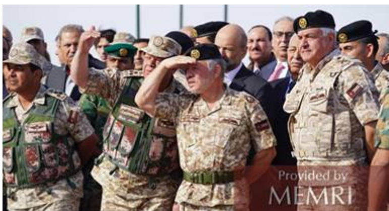
Abdullah II observeert de tactische militaire manoeuvres van het 1e gemechaniseerde bataljon van de Koninklijke Garde van het Jordaanse Centrale Commando.

Op 25 november 2019 meende hij zijn spierballen aan Israël te moeten laten zien door het houden van militaire manoeuvres . De oefening vond plaats met gebruik van tanks, vliegtuigen en helikopters en een groot aantal wapens met het doel "het vernietigen van de voorhoede van de vijand en de bruggen die kunnen worden gebruikt als oversteekplaatsen" naar Jordans grondgebied.