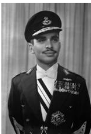
De voormalige koning Hoessein van Jordanië

Wanneer Israël de toenmalige koning Hoessein van Jordanië, de vader van de huidige grootspreker Abdullah, niet geïnformeerd zou hebben over de plannen van Jasser Arafat Jordanië in bezit te nemen, dan zou dit vorstendom niet meer bestaan hebben. Eind zestiger jaren probeerde Arafat koning Hoessein van zijn troon te stoten. Er vonden verschillende mislukte moordaanslagen op Hoessein plaats. Arafat droomde van een Groot Palestina bestaande uit het aloude door de Bijbelse God aan Israël gegeven land, en Jordanië. Arafat toonde toen al de kenmerken van een verwoester want hij bracht Jordanië tot de rand van de afgrond. Zijn gewapende bendeleden liepen rond alsof ze de macht volledig in handen hadden en vielen naar willekeur Jordaanse burgers lastig. De Israëliische geheime dienst maakte Hoessein erop attent dat Arafat bezig was de macht in Jordanië over te nemen, of tenminste een staat in een staat te creëren. Op 16 september 1970 kondigde Hoessein daarop de noodtoestand uit en besloot hij met geweld Arafat en zijn volgelingen uit te schakelen. Het Jordaanse leger nam Arafat's bolwerken in Amman en een aantal andere plaatsen onder vuur waarbij geen onderscheid werd gemaakt tussen burgers en terroristen. Op 18 september probeerde Syrië, d.m.v. de PLA, een pro-Syrische terreurgroep, uitgerust met tanks Arafat en zijn bende in Jordanië te ontzetten maar de Israëliische luchtmacht joeg met een aantal overflights boven de tankcolonne, de terreurgroep weer naar Syrië terug.