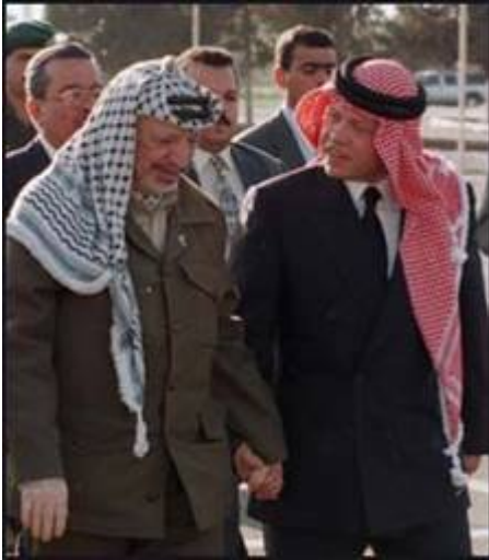
Abdullah hand in hand met aartterrorist Arafat die zijn vader in Jordanië van de troon probeerde te stoten

van vermeende verdachten. Sinds 2003 bestaat er een nauwe militaire samenwerking tussen Jordanië en Saoedi-Arabië. Jordanië bezit een wet die het verbiedt dat Joden burger van dat land kunnen worden of dat een Jordaniër land aan Joden kan verkopen.