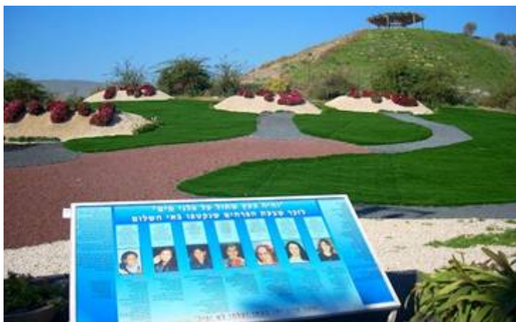
Herdenkingsmonument in Naharayim aan de Jordaanse grens voor de zeven vermoorde Joodse meisjes