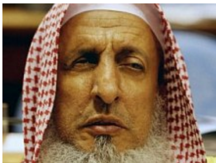
Sheikh Abdul Aziz al-Sheikh bin Abdullah

Er wordt in dit land niet alleen haat gekweekt tegen de Joden, maar ook tegen de christenen. Sheikh Abdul Aziz al-Sheikh bin Abdullah , de grootmoefiti (islamitische opperleider) van Saoedi-Arabië, heeft een oproep gedaan om alle christelijke kerken op het Arabische schiereiland te vernietigen. „ Op dit schiereiland mag alleen de Islam heersen en geen andere vreemde religie. ”. Zijn theologische stelling rechtvaardigde hij met woorden van de profeet Mohammed in de traditionele Hadith, volgens welke er geen twee godsdiensten op het Arabische schiereiland mogen bestaan. Wanneer dergelijke geestelijke leiders oproepen tot vernietiging van kerken in het Midden-Oosten, dan geldt dit als geestelijke goedkeuring.