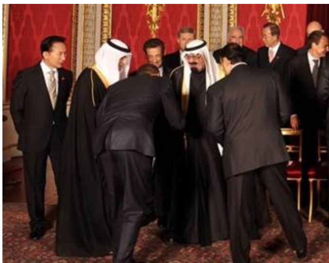
Obama buigt voor de Saoedische koning

De Saoedische ambassadeur in de Verenigde Staten prins Turki al-Faisal vertelde tijdens een bijeenkomst in Washington dat het standpunt van de Verenigde Staten betreffende het Midden Oosten alleen kan worden opgelost door Israël te dwingen „ alle gebieden, inclusief Jeruzalem, af te staan die eigendom zijn van de Palestijnen ”. Dat is inclusief Jeruzalem, de 3000 jaar oude hoofdstad van de Kinderen van Israël. Volgens Turki al-Faisal heeft Riayth geen probleem met de vriendschap van de VS met Israël, maar zegt dat deze relatie gebruikt dient worden om Israël 'onder druk te zetten' de eisen van de Arabieren in te willigen. Daar laat “The prince of War” Barack Hoessein Obama in ieder geval geen gras over groeien.