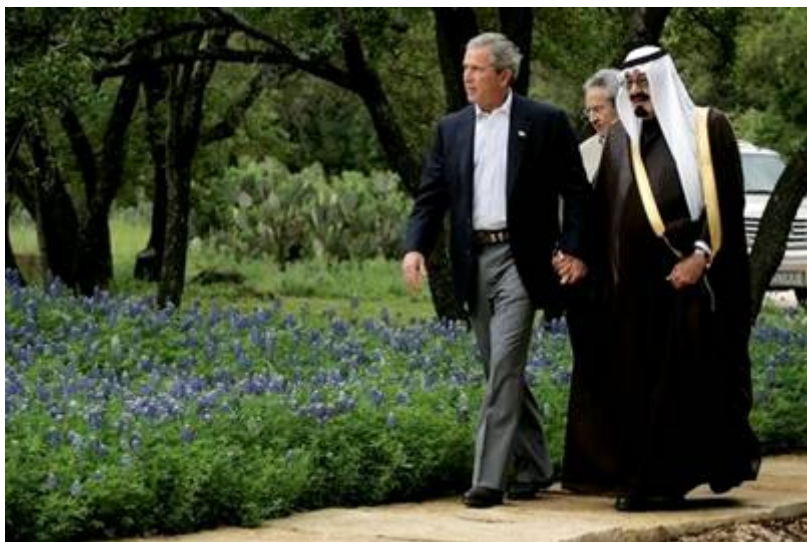
De voormalige Amerikaanse president George W. Bush hand in hand met de op 22 januari 2015 overleden Saoedische dictator Abdullah.

De westerse regeringen kijken alleen maar toe of komen in actie om critici van dit bewind de mond te snoeren en zo de voeten van de voormalige kamelendrijvers te likken. Bijna alle donaties worden in harde munt uitbetaald, waardoor de geldstromen moeilijk te traceren zijn. De New York Times schreef dat een onderzoek in Saoedi-Arabië had uitgewezen dat 95% van de ondervraagden in de leeftijd van 25 tot 41 jaar, sympathiseren met de terreurbeweging Al Qaeda. Naast de steun aan de diverse terreurbewegingen investeert Saoedi-Arabië kapitalen om onder meer Europese en Amerikaanse samenleving te islamitiseren en dat terwijl de Bush familie is al jaren goede maatjes met het Saoedische koningshuis is dat naar schatting twee miljard dollar heeft geïnvesteerd in bedrijven van de familie Bush. Zo was de Prins Bandar bin Sultan van 1983 tot 2005 ambassadeur van Saoedi-Arabië in Washington, en één van de beste vrienden was van George W. Bush. Hij was kind aan huis in het Witte Huis en had daarom de bijnaam Bandar-Bush. Bandar werd vanaf 2005 secretaris-generaal van de Saoedische Veiligheidsraad en van 2012 tot 2014 chef van de geheime dienst van Saoedi-Arabië.