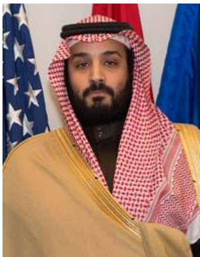
Mohammed bin Salman

Ook Salman is niets anders dan een nietsontziende tiran. Dat was onder meer te zien aan de meedogenloze manier waarop hij zijn broers, neven en oom aan de kant heeft gezet om zelf de macht te grijpen. Die arrestaties waren vooral een manier om zijn macht te tonen, rivalen te vernederen en ze – zonder proces – miljarden aan afkoopsommen afhandig te maken. Landgenoten die kritiek op hem hebben verdwijnen steeds vaker in de cel of erger. Ook de brutale gijzeling van de Libanese premier Saad Hariri in november 2017 tijdens een bezoek aan Riad in een mislukte poging hem tot aftreden te dwingen kwam uit de koker van Bin Salman en niet te vergeten de moord op criticus Khashoggi . Het is uitgesloten, zeggen analisten, dat zo'n operatie is uitgevoerd zonder instemming van kroonprins Mohammed bin Salman.