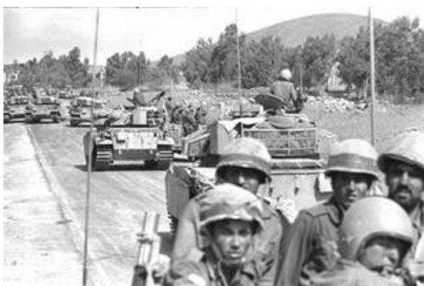
Israëlische troepen trekken richting Syrië

De Syriërs rukten de eerste dag op tot ongeveer halverwege het Meer van Galilea, terwijl Syrische commando's de observatiepost op de berg Hermon innamen. Bovendien konden de Syriërs met hun luchtdoelgeschut 40 Israëlische vliegtuigen neerhalen. Syrië had zich echter misrekend in de snelheid waarmee Israël reservisten kon oproepen. Men rekende op ten minste 24 uur, maar reeds na 6 uur verschenen de eerste reservisten aan het front. Dit kwam deels doordat het mobiliseren makkelijker ging dan gedacht, omdat alle reservisten dan wel thuis dan wel in de synagoge zaten. Anderzijds gaf Israël prioriteit aan de verdediging van de Golan hoogvlakte. Het gebied was te klein om als buffer te functioneren, maar vanaf de Golan hoogvlakte konden wel de Israëlische steden gebombardeerd worden met artillerie. In het ergste geval kon dit natuurlijke fort als uitvalsbasis worden gebruikt voor een aanval richting Galilea en Tel Aviv.