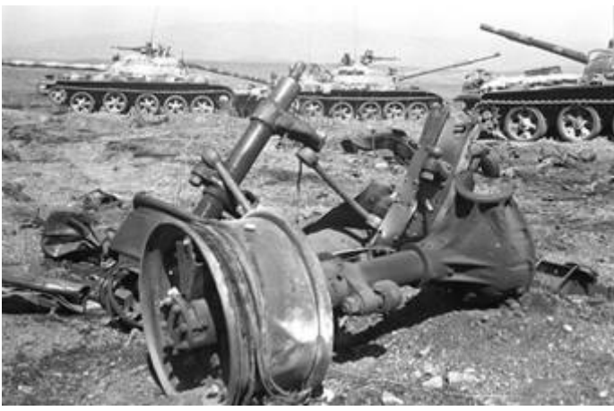
Israëlische troepen op 101 km van Cairo.

Bij de Egyptisch-Syrische coalitie sneuvelden in totaal 35.000 soldaten, meer dan 15.000 raakten gewond, 8300 werden krijgsgevangen genomen. De Egyptische luchtmacht verloor 235 vliegtuigen en de Syrische 135. Aan Israëls zijde waren 2.297 doden te betreuren en meer dan 7.200 gewonden, 314 Israëliërs werden krijgsgevangen genomen, en tientallen raakten zoek. Het Israëls leger verloor 102 vliegtuigen en ongeveer 800 tanks. De Israëls publieke opinie was geschokt over deze getallen en ging wanhopig op zoek naar zondebokken. De Arabische verliezen waren weliswaar veel hoger, maar in verhouding kwamen de verliezen van Israël veel harder aan. Deze oorlog maakte een einde aan de mythe van de Israëls militaire onschendbaarheid. De nipte overwinning voedde in Israël de overtuiging van een meerderheid in het land dat het voor Israël noodzakelijk was om ook in de toekomst te zorgen voor een kwalitatief militaire superioriteit over de gecombineerde strijdkrachten van de Arabische vijanden.