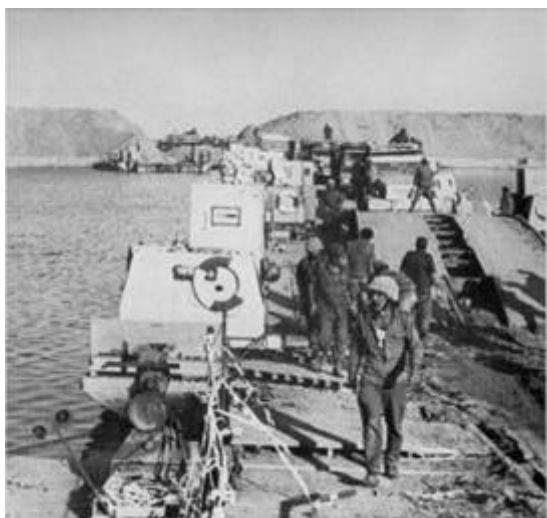
Israëlische soldaten steken het Suezkanaal over richting Cairo in Egypte

bruggenhoofd uitgebreid. Sadat weigerde echter zijn troepen terug te trekken uit de Sinaï, waardoor uiteindelijk 70.000 manschappen plus 720 tanks opgesloten zaten terwijl Israëlische troepen richting Cairo oprukten. Op 21 oktober was de omsingeling compleet, het Egyptische tweede leger, dat opereerde in de Sinaï, was afgesneden van het eerste leger. Bevoorrading was onmogelijk geworden. De oorlog dreigde voor Egypte op een vernietigende nederlaag uit te lopen.