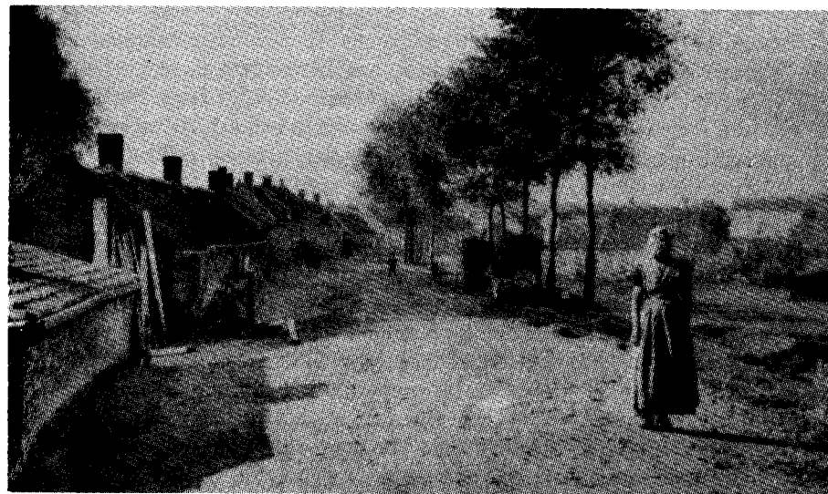
Wolphaartsdijk. Op de voorgrond de Noorddijk. Op de achtergrond (achter het hoofd van de vrouw) de kerk van Middel en links daarvan staat de pastorie, die aan de kerk gebouwd is.

Heere gaf mij daarin genoegzame kracht, zodat ik, met uitzondering van lichte ongesteldheden, Jezus in Zijn leidingen, onder veel gebed en smekingen mocht volgen.