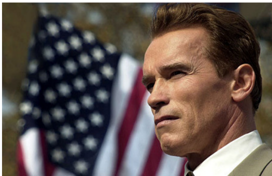
Arnold Schwarzenegger ,gouverneur van Californië

VS en topman van het Bechtel concern dat na de inval in Irak vette opdrachten heeft binnengehaald om in Irak aan de slag te gaan. In september 2002 was Schwarzeneggers te gast op een geheime bijeenkomst in Waddeson Manor (landgoed van Lord Jacob Rothschild) in Engeland. Dit is destijds door het Britse dagblad The Times onthuld. Maar deze publicatie trok geen enkele aandacht, want niemand wist nog dat men Schwarzenegger naar voren wilde schuiven voor de post van gouverneur van Californië. Op het landgoed van Rothschild is de kandidatuur van Schwarzenegger voorbereid door machtige financiers en politici. Schwarzenegger, bekend als de "Terminator" (vernietiger/verdelger) fungeert thans als marionet van de Illuminatie en loopjongen van de Bush dynastie. Hij geniet alom grote bekendheid en heeft wereldwijd een enorm aantal fans. Velen zien in hem de komende antichrist maar dat etiket hebben al velen voor hem ook opgeplakt gekregen.