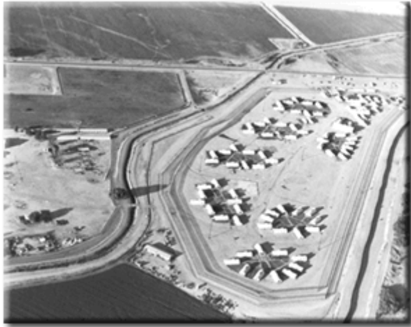
concentratiekamp in Arizona

Klik voor meer informatie over deze kampen op: http://revlu.com/camps.htm Verschillende bronnen melden dat de "Elite" hier de vijanden van de staat wil opsluiten. Het zou gaan om islamitische terroristen en in een later stadium ook om de tegenstanders van de Nieuwe Wereld Orde die weigeren in het gareel van Illuminatie te lopen. In een publicatie onder de titel "Camps for Citizens" verteld de auteur Jonathan Turley dat de Amerikaanse minister van Justitie John Ashcroft een plan heeft opgesteld dat hem de mogelijkheid biedt, toekomstige tegenstanders van de staat zonder vorm van proces op te sluiten en hen hun burgerrechten te ontnemen.