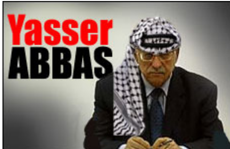
Abu Mazen (Mahmoed Abbas)

Wereldwijd werd de PA/PLO terreurbaas 'president' genoemd, en zo noemt men de huidige leider Abu Mazen (Mahmoed Abbas) ook, maar er is geen 'Palestijnse staat', dus ook geen 'president'.