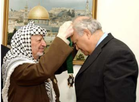
Moratinos voor de zoveelste keer te gast in Arafat's rovershol in Ramallah. 'Hallo grote vriend ben je daar weer, kom krijg je van mij een dikke pakkerd en een medaille voor het demoniseren en schofferen van de zionistische entiteit'.