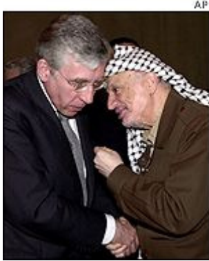
Jack Straw-Jasser Arafat