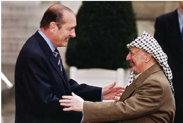
Jaques Chirac met zijn grote vriend Arafat

van voormalige Franse president Mitterrand. Al in 1981 genoot het PLO-kantoor in Parijs officiële erkenning die grensde aan het niveau van een ambassade.