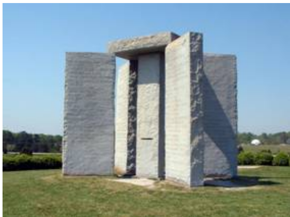
De Georgia Guidestones

Boven op één van de hoogste heuvels in Elbert County in de Amerikaanse Georgia stond een reusachtig granieten monument. Dit monument is op 6 juli 2022 voor een deel opgeblazen en de rest gesloopt.