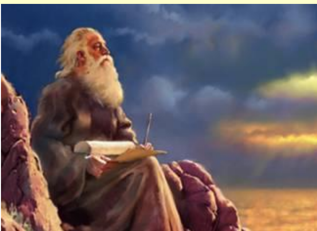
Johannes op Patmos

Het boek Openbaring maakt duidelijk dat Johannes aanwezig mag zijn bij het hemelse openingsceremonieel van het Boek met Zeven Zegels, waarin Gods grote eindafrekening met onze wereld is beschreven. God zal handelend gaan optreden. Johannes ziet wat er vanuit Gods perspectief staat te gebeuren.