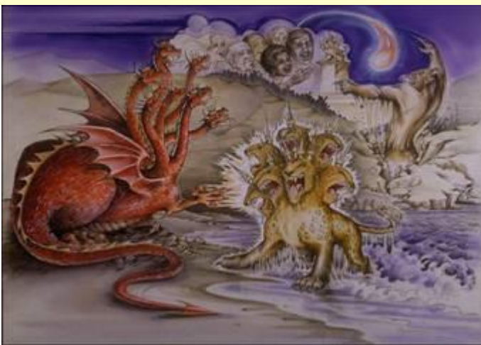
Het beest uit de zee

Door de vrucht van hun handelingen zal de aarde verder worden ontwijd door de nep-messias. Een wetteloze zoals de wereld nog nooit eerder gezien heeft. Hij is een vazal van de Draak, de duivel, de leugenaar en de mensenmoordenaar vanaf het begin. Hij heeft alle macht gekregen om de mens te misleiden. Ze zullen dit beest zelfs aanbidden en zullen daardoor de toorn moeten ondergaan.