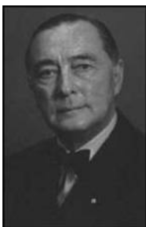
Richard Nicolas Coudenhove Kalergi

Dat er geen asielstop komt heeft zoals gezegd alles te maken met de uitvoering van het racistische plan van Richard Coudenhove-Kalergi (1894-1972), het zogeheten Kalergiplan voor de omvolking van Europa. Af en toe verschijnen er artikelen waarin dit plan wordt toegelicht. De schrijvers worden echter in de mainstream-media en door zogenaamde factcheckers weggezet als rechts-populisten, aanhangers van complottheorien en verspreiders van fake-nieuws. Maar wat Coudenhove-Kalergi heeft verkondigd laat niets aan duidelijkheid te wensen over. Niks complottheorieën want een deel van de Europese leiders voeren zijn plannen exact zo uit.