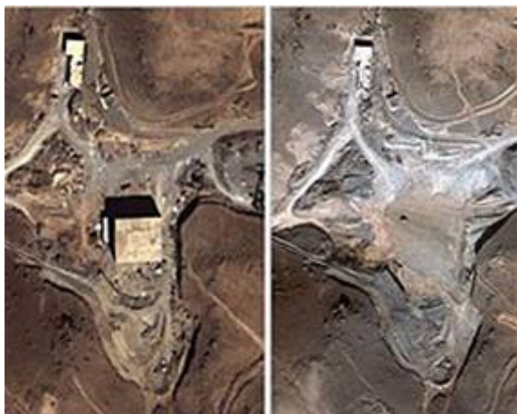
Door Israël platgebombardeerde reactor in Al Kibar, noord Syrië.

Volgend op deze zeldzame commando actie, hebben Israëlische vliegtuigen op 6 september 2007 in een al even nauwkeurig geplande en werkelijk briljant uitgevoerde aanval, de betrokken locatie met de grond gelijk gemaakt. De actie duurde amper 18 minuten. Ook deze gebeurtenis vond plaats zonder dat de vliegtuigen werden opgemerkt. De Israëlische toestellen werden begeleid door een met elektronische apparatuur uitgerust vliegtuig om de radarapparatuur te storen. Niet alleen de radar werd door Israël buiten werking gesteld, maar ook allerlei andere communicatiesystemen zoals computers en mobiele telefoons, tot in Libanon toe. Syrische commentatoren wisten aanvankelijk niet eens te vertellen van waaruit de Israëlische toestellen het Syrische luchtruim waren binnengedrongen.