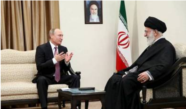
Poetin en de Iraanse terreurleider Ali Khamenei

Teheran heeft inmiddels een Iraanse satelliet met een Russische raket de ruimte in gestuurd. De samenwerking tussen Rusland en Iran in de ruimte is vooral zorgwekkend voor Israël, omdat het betekent dat Iran zijn satellieten kan gebruiken om Israël te bespioneren of erger nog.