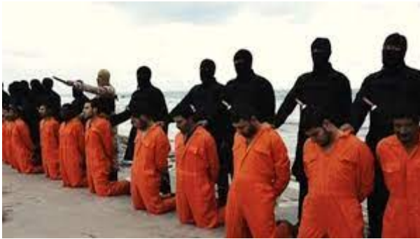
Koptische christenen onthoofd door hellehonden van ISIS in Libië

christenen in Libië is de ontdekking van stoffelijke resten van eenentwintig Koptische christenen door de Libische politie in oktober 2017 van wie de keel waren doorgesneden door de hellehonden van ISIS. Het bloedbad zou in januari 2015 hebben plaatsgevonden. Op 15 februari 2016 verscheen een video van mannen gekleed in oranje pakken op hun knieën gebogen, elk met een in het zwart geklede islamitische koppensneller achter zich. Enkele moordenaars werden later opgepakt en vertelden waar de lijken van de afgeslachte christenen te vinden waren.