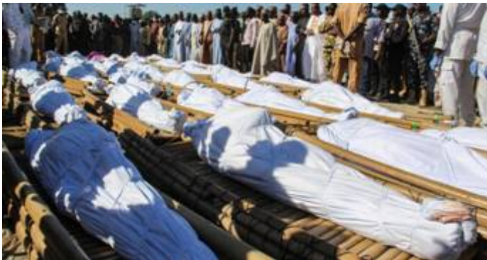
Gruwelijke slachtpartijen door islamitische barbaren in Nigeria

In de centrale staten van Nigeria staan de islamitische Fulani-herders erom bekend christenen te vermoorden en te verdrijven. Ze vallen geïsoleerde christelijke gemeenschappen aan en steken alles in brand wat ze tegenkomen. Op 22 januari 2022 vermoordden deze slachters vier christenen in de deelstaat Plateau, nadat op 11 januari 18 christenen waren gedood in een ander deel van de staat. Bij de twee aanslagen raakten acht andere christenen gewond en in één dorp werden 24 huizen platgebrand. Op 30 januari 2022 werden bij een aanval in het noorden van Nigeria door Fulani-herders 11 christenen gedood.