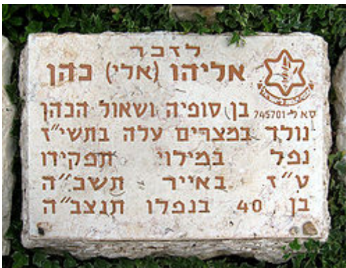
Monument voor Cohens nagedachtenis in Herzlberg in Jeruzalem

Na een proces werd hij in het openbaar op 18 mei 1965 in Damascus opgehangen. De executie werd in Syrië rechtstreeks op televisie uitgezonden. Hoewel er verschillende verzoeken zijn geweest, is zijn lichaam nooit teruggegeven aan zijn familie. Het werd begraven op de Joodse begraafplaats van Damascus. Klik hier voor de video: Eli Cohen: The Mossad's Master Spy.