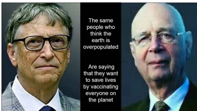
Axis of evil: Bill Gates en Klaus Schwab

Dr. Peter A. McCullough, een van de meest geciteerde artsen m.b.t. de Covid-19 zwendel, beschuldigd in een interview de Amerikaanse overheid ervan 'onvoorstelbare aantallen' vaccinslachtoffers toe te dekken. McCullough legt uit dat als het om andere vaccins dan tegen Covid-19 was gegaan, deze ogenblikkelijk van de markt zouden zijn gehaald vanwege veiligheidsproblemen. "Bij enig nieuw medicijn waarbij 5 onverklaarbare doden vallen, krijgen we een 'black box' waarschuwing, en dan hoor je ook op TV dat dit middel tot de dood kan leiden. En bij 50 doden wordt het van de markt gehaald" aldus McCullough. Tijdens de varkensgriep pandemie in 1976 wilde de Verenigde Staten 55 miljoen burgers vaccineren, maar op het moment dat er 25 doden door dit vaccin waren gevallen en er ongeveer 500 mensen verlamd waren geraakt, werd het programma stopgezet. Nu gebeurt in zowel Amerika als Europa exact het omgekeerde: hoe verder het aantal slachtoffers oploopt, des te meer druk wordt er door overheden op de bevolking uitgeoefend – inclusief de Nederlandse – om zich te laten vaccineren.