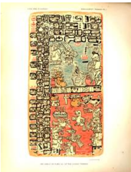
Een onderdeel van het Troano Manuscript

Het " Troano-Manuscript " een overlevering van de Maya's, vertelt over een asteroïde die zich als vlamme fakkels richting de aarde spoedt. “Plotseling werd de aarde getroffen door een verschrikkelijke ramp toen de ster Bal op de aarde viel. Het begon te lichten aan de hemel en er voltrok zich een wonderlijk schouwspel. Degenen die daar een teken van komende rampspoed in zagen, vluchten weg. Er leek grind en hagel neer te komen en er leek vuur uit de hemel te vallen. Weinig mensen ontkwamen aan deze catastrofe. Wouden werden verpletterd. De duisternis kreeg de aarde in zijn greep en de sterke armen van Homen veroorzaakten geweldige aardschokken die de wereld teisterden. De aarde slingerde en kantelde en orkaanwinden zweepten langs het gehavende aangezicht van de wereld. Ontploffingen schokten de hele wereld toen de gebroken aardkorst, lava begon te spuwen. Een vreselijke hitte hing over de aarde en de zee begon te koken.”