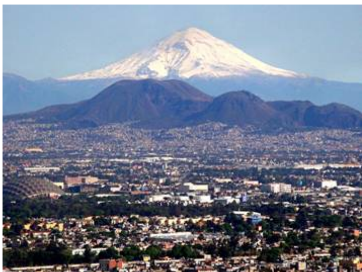
De Popocatepetl in Mexico.

Weinig natuurlijke processen zijn zo spectaculair als vulkanisme. Er kunnen temperaturen optreden van wel 1350 graden Celsius. Er zijn ruim 15.000 vulkanen op aarde waarvan er ca 16 heel gevaarlijk zijn en regelmatig actief. Tot de meest gevaarlijkste vulkanen ter wereld behoren onder meer de boven genoemde Krakatau in Indonesië- Yellowstone Park in de Verenigde Staten- de Fuji in Japan en de 5426-meter hoge Popocatepetl in Mexico .