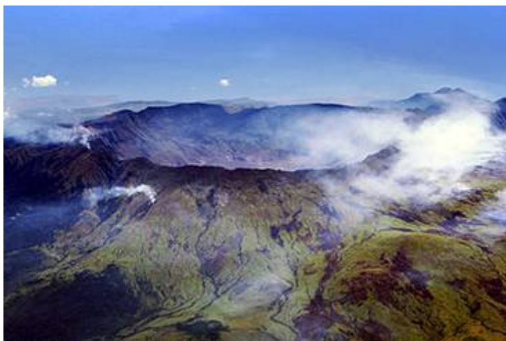
Tambora Vulkaan (Afbeelding Wikipedia)

De Tambora is een stratovulkaan op het Indonesische eiland Soembawa. De vulkaan bevindt zich op een schiereiland hiervan en maakt deel uit van de Sandoboog. In het noorden grenst het schiereiland aan de Floreszee, in het zuiden aan de Saleh-baai. De Tambora ligt ongeveer 340 kilometer ten noorden van de Soendatrog. Op zeeniveau heeft de vulkaan een diameter van zo'n 60 kilometer. Naar schatting is de Tambora 57.000 jaar geleden gevormd. Op 10 april 1815 barstte de vulkaan uit. Met een vulkanische-explosiviteitsindex van 7 was dit de grootste uitbarsting die ooit rechtstreeks door mensen is waargenomen. De oorspronkelijk ongeveer 4200 meter hoge vulkaan verloor hierbij ongeveer een derde van zijn hoogte en meet sindsdien circa 2800 meter. Er ontstond een krater van zes kilometer in doorsnede. De laatste bekende uitbarsting vond plaats in 1967, maar dit was slechts een kleine uitbarsting. In augustus-september 2011 steeg het activiteitsniveau van I naar II.