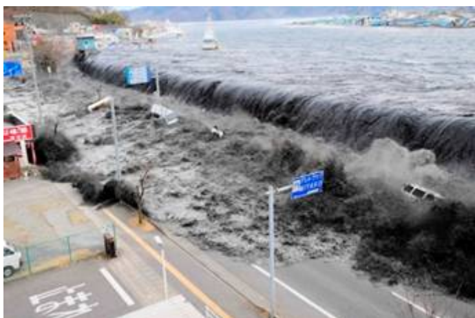
Tsunami Japan 11 maart 2011

Ook Japan wordt regelmatig door aardbevingen getroffen. Zo vielen op 1 september 1923, 99.300 doden in Jokohama en datzelfde jaar 200.000 doden in Tokio. De aardbeving op 17 januari 1995 kostte zeker 6434 mensen het leven in Kobe. Op 11 maart 2011 vond aan de noordoostkust van Japan een zeebeving plaats met een kracht van 9.0 op de schaal van Richter . Het officiële aantal doden en vermisten lag op 14 mei 2011 op 24.525. 410.000 mensen werden geëvacueerd uit de getroffen gebieden. De zeebeving veroorzaakte een tsunami, die veel schade aanrichtte in Japan. De tsunami had een hoogte van meer dan 15 meter en bereikte eenmaal aan land op sommige plaatsen door opstuwing een hoogte van meer dan 20 meter. Er werd ruim 400 km 2 land overspoeld. Miljoenen huishoudens kwamen door de ramp zonder stromend water of elektriciteit te zitten. Bij drie kernreactoren van de kerncentrale Fukushima I ontstonden ontploffingen en vond mogelijk een kernsmelting (meltdown) plaats.