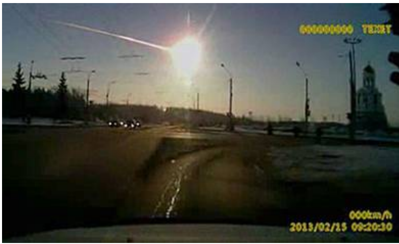
Meteoriet explodeert in de stad Chelyabinsk

Gebouwen trilden op hun grondvesten, duizenden ramen vlogen aan diggelen in het koude winterweer en alarmsystemen in auto's begonnen spontaan te loeien. Er vielen circa 1200 gewonden waaronder ruim 200 kinderen voornamelijk veroorzaakt door rondvliegende glasscherven. Volgens de NASA naderde het naar schatting tien ton wegend brokstuk met een snelheid van circa 20 kilometer per seconde de atmosfeer en barste vervolgens in stukken uiteen. De Chelyabinsk regio ligt ongeveer 1500 km ten oosten van Moskou en