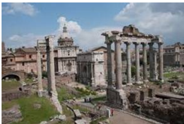
Ruïnes van de Tempel van de godin Cybele

Sardes was eens een rijke handelsstad en de hoofdstad van het oude koninkrijk Lydië en de residentie van de legendarische koning Kroisos (Croesus). De stad werd aan het begin van de jaartelling herbouwd nadat ze door een aardbeving volledig verwoest was. Het ging van de Lydische monarchen over in de handen van de Perzen en vandaar naar Alexander de Grote . Het werd geplunderd door Antiochus de Grote. Daarna voerden de koningen van Pérgamum er de heerschappij totdat de Romeinen de macht in handen kregen. De godsdienst van deze stad was de verering van de godin Cybele . De massieve ruïnes van de tempel zijn thans nog te bezichtigen.