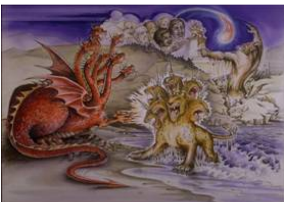
Het beest uit de zee, de antichrist

Het is de geest van de antichrist de geest van de duisternis die het bestaan van de Vader en de Zoon loochent. Menig Bijbelgetrouw gelovige vraagt zich in verbijstering af waar het met de kerk naar toe moet met deze dwaalgeesten aan het roer?