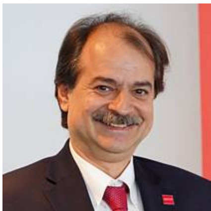
Prof. John Ioannidis

In de loop van het voorjaar van 2020 werden wereldwijd de sterftcijfers sterk overdreven door dit te associëren met sterfgevallen die weinig tot niets met het virus zelf te maken hadden, om angst en gehoorzaamheid maximaal af te dwingen en te houden. Mensen die stierven aan wat voor aandoening dan ook, werden allemaal aan Covid-19 toegeschreven. Volgens Rutte&Co en de mainstream media stroomden de ziekenhuizen in het voorjaar van 2020 vol met coronapatiënten. Bij nader onderzoek bleek er echter geen enkel verschil te bestaan met bijvoorbeeld de griepjaren 2016 of 2018 . Ieder jaar overlijden er in Nederland gemiddeld 6.443 personen direct of indirect aan griep. In het begin van 2020 niet, want er was plotseling geen griep meer. Slechts met moeite hebben ze ruim 400 griepdoden kunnen ontdekken. Niet alleen in ons land, maar in alle landen. In diverse landen zoals Zuid-Afrika verschenen grote koppen in de kranten waarin men zich verbaasd afvroeg waar de griep was gebleven. 'Zie ook hier hoe de wereldberoemde professor John Ioannidis van de Stanford-universiteit concludeert dat het sterftcijfer bij corona niet meer dan ongeveer 0,2 procent is. Vergelijkbaar met griep.