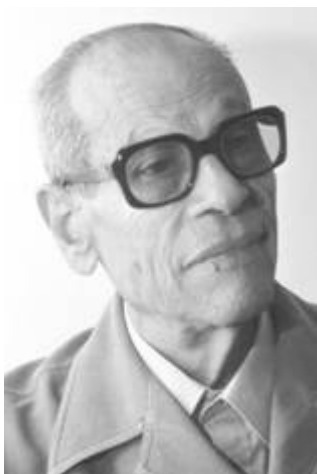
Nobelprijz winnaar literatuur Naguib Mahfouz

Hiermee laat ook Brussel weer eens zien dat het koste wat kost hun tirannieke doeleinden wil bereiken. Facebook heeft al laten weten hard op te zullen treden tegen eenieder die het waagt om via Facebook desinformatie te verspreiden. Desinformatie is dan wat hen betreft alles wat riekt naar echte waarheid. De wereldbevolking wordt geconfronteerd met de grootste leugenmachine uit de geschiedenis. Het zijn juist de overheden en de mainstream media die nepnieuws verspreiden. Om met de woorden van de Egyptische Nobelprijswinnaar literatuur (1988) Naguib Mahfouz te spreken: “Zij liegen... en zij weten dat ze liegen... en zij weten dat wij weten dat ze liegen... en ondanks dat gaan ze door met nog meer te liegen” .