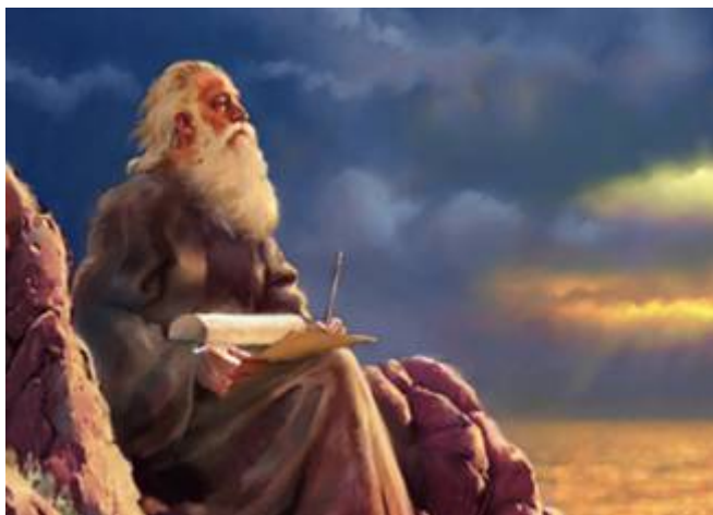
Johannes op Patmos

Het boek Openbaring maakt duidelijk dat Johannes aanwezig mag zijn bij het hemelse openingsceremonieel van het Boek met Zeven Zegels, waarin Gods grote eindafrekening met onze wereld is beschreven. God zal handelend gaan optreden. Johannes ziet wat er vanuit Gods perspectief staat te gebeuren.