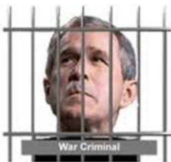
George W. Bush beschuldigd van oorlogsmisdaden

Het Kuala Lumpur Tribunaal haalde bepalingen aan van het Internationale Militaire Tribunaal van Neurenberg , waar kort na de Tweede Wereldoorlog de kopstukken van het Naziregime werden veroordeeld. Artikel 6 van het Neurenbergse Handvest stelt dat 'leiders, organisatoren, aanstichters en medeplichtigen, die deel uitmaken van plannen of de uitvoering van deze plannen of deel uit maken van een samenzwering om oorlogsmisdaden te begaan, verantwoordelijk zijn voor alle misdaden die zijn begaan.' Deze artikelen uit het Neurenbergse Charter zijn algemeen geaccepteerd als internationaal recht door de Verenigde Naties. De oorlogsmisdaden van Bush en consorten vallen dus onder het internationale recht.