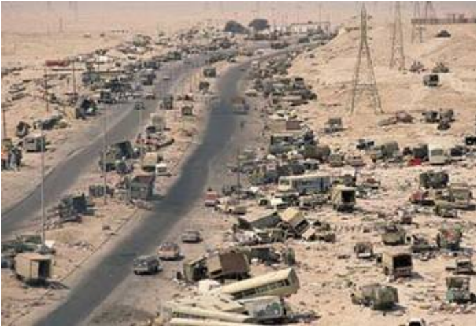
Onvoorstelbare slachtpartij op de snelweg naar de dood

Bush werd geboren in de staat Connecticut, als eerste kind van George H.W. Bush en zijn vrouw Barbara Bush en telg uit een familie van politici. Zijn grootvader Prescott Bush, was senator en zijn vader was president van 1989 tot 1993. George H.W. Bush stond aan de basis van " Operatie Dessert Storm " een door de Verenigde Staten geleide coalitiemacht van 34 landen om Saddam Hoessein te straffen voor diens invasie in Koeweit. Tijdens deze oorlog zijn afschuwelijke slachtingen aangericht waarbij honderdduizenden doden aan Iraakse kant zijn gevallen. Een oorlogsmisdaad van de allerergste soort. http://www.youtube.com/watch?v=3NCLfhmWvJ8