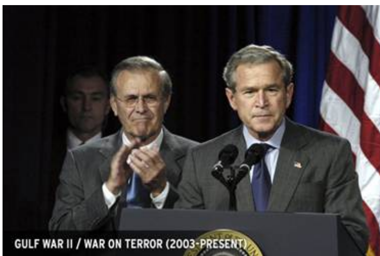
Twee van de hoofdrolspelers, George W. Bush en Donald Rumsfeld

Minister van Buitenlandse Zaken Colin Powell drong erop aan dat de Verenigde Staten geen oorlog zou voeren zonder de goedkeuring van de Verenigde Naties. Maar het verzoek hiertoe bij de VN mislukte omdat de meerderheid van de leden van de Veiligheidsraad tegen het idee waren en Frankrijk met een veto dreigde. Vervolgens kreeg Washington een groep van ongeveer veertig landen zover met hem mee te doen waaronder het Verenigd Koninkrijk, Spanje, Nederland, Polen, Italië in wat men de “coalitie van willenden” noemde. De coalitie viel Irak in maart 2003 binnen. Bush zei dat ná de inval de “wereld er veiliger” uit was gaan zien. Tienduizenden Iraakse burgers hebben sindsdien het leven verloren door zelfmoordaanslagen van elkaar bestrijdende islamitische partijen. In december 2006 gaf Bush voor het eerst toe dat hij niet aan het winnen was in Irak. Tariq Aziz, Saddams voormalige minister van Buitenlandse zaken zei in december 2011 : “Er is niets meer over van ons welvarende Irak. Alles wat Saddam Hoessein heeft opgebouwd is verwoest. Er zijn meer zieken en hongerigen dan ooit tevoren. Velen hebben geen werk en ieder dag vallen er doden. Irak is het slachtoffer van Amerika en Groot-Brittannië. Zij hebben ons land vermoord”.