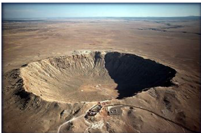
Diablo Canon Arizona

Wat hier wordt beschreven vind plaats in de tijd dat de antichrist op aarde regeert . Zelfs in vrij recente tijden zijn er heel wat kosmische brokstukken op de aarde ingeslagen.