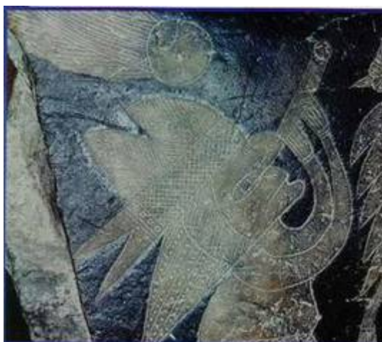
Ica steen met komeet die zich langs de hemel voortbeweegt

In een museum in Ica in Peru in Zuid Amerika, liggen ca 20.000 gegraveerde stenen. Deze stenen bevatten volgens Dr. Cabrera Darquea, de beheerder van deze bibliotheek, een deel van de geschiedenis van Zuid-Amerika. Op een van de stenen is een komeet te zien die zich langs de hemel voortbeweegt met een geweldige staart, terwijl de kop van de komeet door een bol wordt voorgesteld zoals de mensen van alle tijden dat hebben gedaan. Een overlevering uit die regio vertelt dat de komeet in drie delen op de aarde te pletter sloeg.