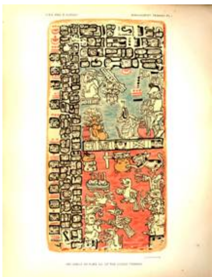
Het Troano Manuscript

Volgens het " Troano-Manuscript " een andere Maya overlevering werden vele gebouwen tot ruines. Nadat de alles verwoestende ramp het land had getroffen was het voor lange tijd onbewoonbaar. Dit Maya-boek dat rijkelijk voorzien is van tekeningen toont ook een beeld van een tweetal meteorieten die zich als vlamme fakkels naar de aarde spoeden.