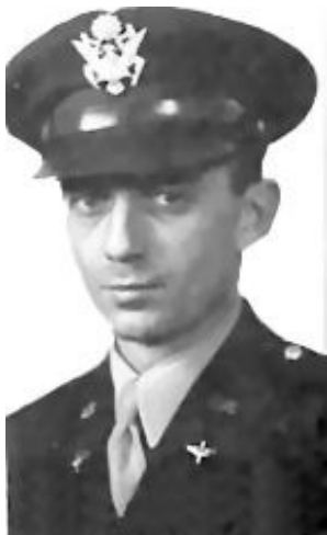
Luchtmachtofficier Jesse A.Marcel

Maar een gepensioneerde luchtmachtofficier Jesse A.Marcel, die de brokstukken in 1947 had onderzocht zei jaren later dat het wel degelijk om een UFO ging. Volgens hem was het weerballonverhaal bedacht door de militaire autoriteiten om de zaak in de doofpot te stoppen. Maar Marcel bleef beweren dat 'het voertuig' niet van deze wereld was. http://www.roswellfiles.com/Witnesses/MarcelMyths.htm