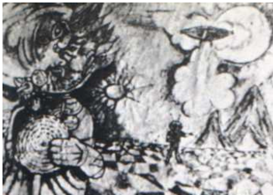
Grottekening van ca 2000 v.Chr.

Op de grens van Rusland en China is een grottekening gevonden waarop een figuur te zien is in een soort ruimtepak met twee antennes op zijn hoofd. Daarboven is een vliegend voorwerp te zien wat een pluim rook uitstoot.