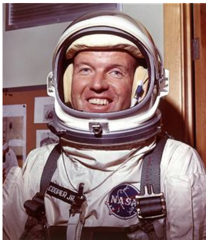
Astronaut Gordon Cooper