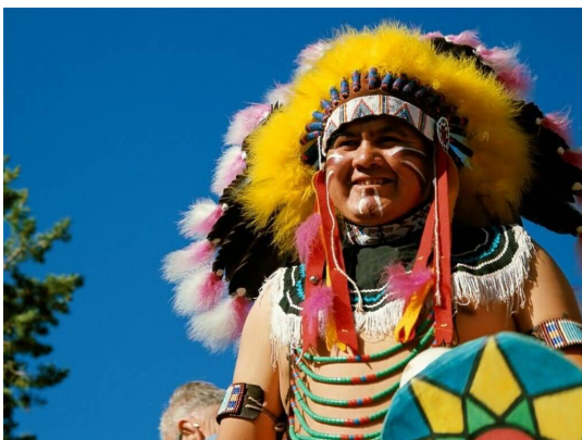
Hopi indiaan Arizona

Er was een overstroming. De wateren werden over de aarde uitgestort. Golven die hoger waren dan bergen, rolden aan op het land. De continenten scheurden en verzonken in de golven. Na de overstroming bevonden de overlevenden zich op de top van één der hoogste bergen. Al het overige lag onder water. Op de zeebodem lagen alle trotse steden en alle andere wereldse schatten, verdorven door het kwaad. Er werd een nieuwe wereld geschapen en de mensen werden door de afgezant van de Schepper vermaand om het plan van de schepping uit te voeren, anders zal ook de "vierde wereld" aan haar einde komen.