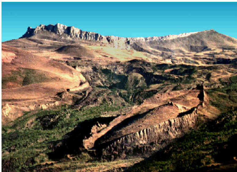
Overblijfselen van de Ark van Noach?

satellietfoto's van de berg Ararat, sporen van de ark te hebben gezien. Het onderzoek met behulp van de satellietfoto's naar het bijbelse vaartuig is echter gestrand omdat de Turkse autoriteiten niemand toelaten op de hellingen van de berg Ararat. De plek waar de restanten van Noach's schip te vinden zouden zijn ligt in militair gebied. Koerden uit de regio beweren dat de streek in 1948 door een aardbeving getroffen werd en dat nadien een gedeelte van de ark aan de oppervlakte is gekomen.