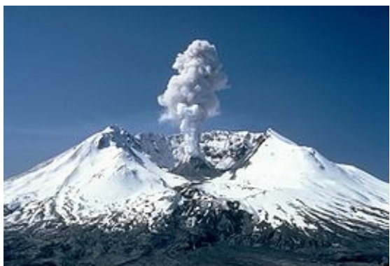
Uitbarsting St Helens 18 mei 1980

Steeds meer wetenschappers erkennen dat er in het verleden een enorme waterramp de aarde moet hebben geteisterd. Lange tijd heerste de gedachte dat de verschillende aardlagen heel traag sedert miljoenen jaren moeten zijn gevormd. Maar er bestaan steeds meer twijfels t.a.v. deze visie. De enorme uitbarsting van de vulkaan St. Helena in de staat Washington in de Verenigde Staten, op 18 mei 1980, zorgde voor vierhonderd miljoen ton hete as die 30 kilometer omhoog werd gespuwd. De onmetelijke lavastroom vernietigde alles op zijn weg en gigantische modderstromen sleurden onderweg slijk, stenen, bomen, zand en dieren mee. Volgens diverse geleerden was deze uitbarsting te vergelijken met een kracht van ruim 20.000 atoombommen. In de nabij gelegen vallei vormde zich in ca. vijf jaar een nieuwe laag gesteente tot wel 200 meter dik. Toen wetenschappers in 1996 met de meest moderne technieken en dateringsmethoden probeerden vast te stellen hoe oud dit gesteente was, kwam men op ouderdommen van 350.000 tot 3 miljoen jaar. In werkelijkheid was het gesteente pas 16 jaar oud. De betrouwbaarheid van de gehanteerde dateringsmethodes wordt daarom terecht, steeds meer in twijfel getrokken.