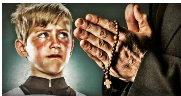
'Laat de kinderen tot Mij komen...'