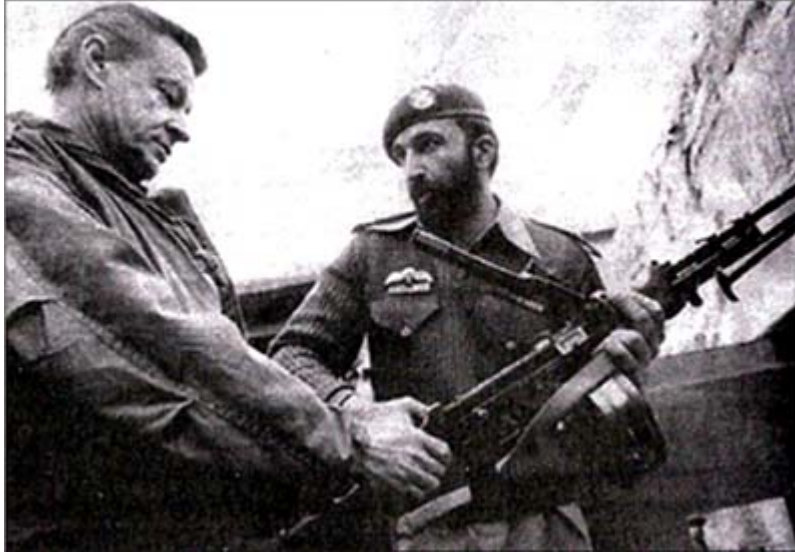
Zbigniew Brzeziński en Osama Bin Laden samen tijdens de Sovjetoerlog in Afghanistan

Afghanistan zelf werd 'opgeofferd' in het proces, de sociale structuren van het land werden afgebroken, en elk sprankje hoop dat de bevolking nog had, werd de grond in geboord.