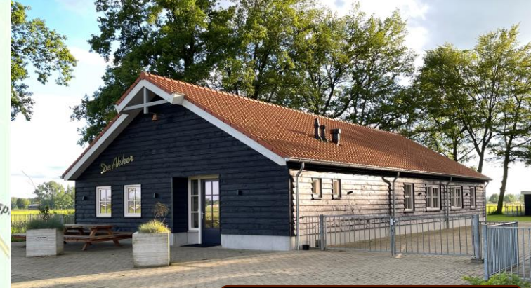
Herv. wijkgebouw De Akker